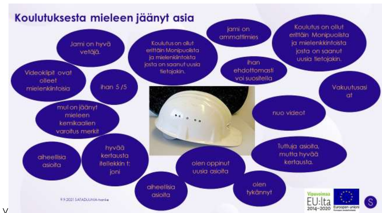
Kuva 2. Osallistujien kommentit koulutuksesta ja siitä mieleen jääneistä asioista.

Koulutuspäivässä 9.9.2021 annetut kommentit koulutuksesta ja siitä mieleen jääneet asiat olivat hyvin saman suuntaisia kuin palautekyselyyn tulleet vastaukset.