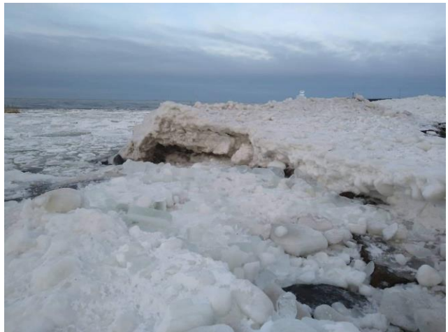
Kuvat: Tammikuun tunnelmia Raumalta ja Mäntyluodon Kallosta kuvasi Outi Lähteenlahti